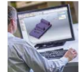
F & E-Zentrum